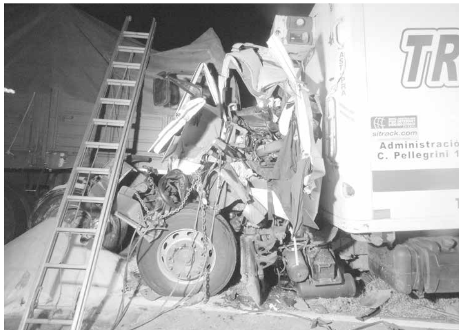
Estado en el que quedó el camión VW tras el fuerte impacto.

Constituido el personal en el lugar de los hechos se estableció que los vehículos de transporte involucrados resultaron ser un camión Volkswagen con acoplado, conducido por Javier Olivera, domiciliado en la localidad de Longchamps, que transportaba sal; y otro camión de la misma marca conducido por Carlos Vidart, domiciliado en Gral. Roca, provincia de Río Negro, que transportaba sustancias