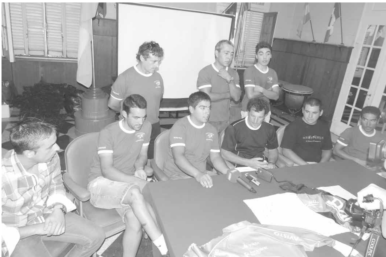
Competidores de la carrera junto a funcionarios municipales y del Club Ciclistas Unidos.