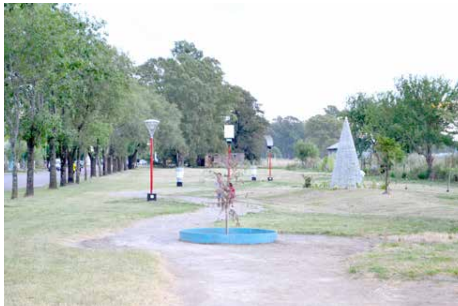
Vista del espacio verde perfectamente iluminado.