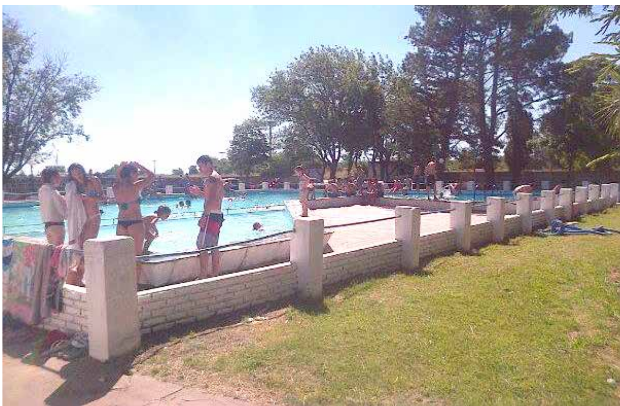
Dos imágenes que muestran los natatorios del Club Atlético Quiroga en pleno funcionamiento