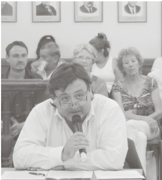
El edil sostuvo que los temas de estado fueron planeados por la oposición.