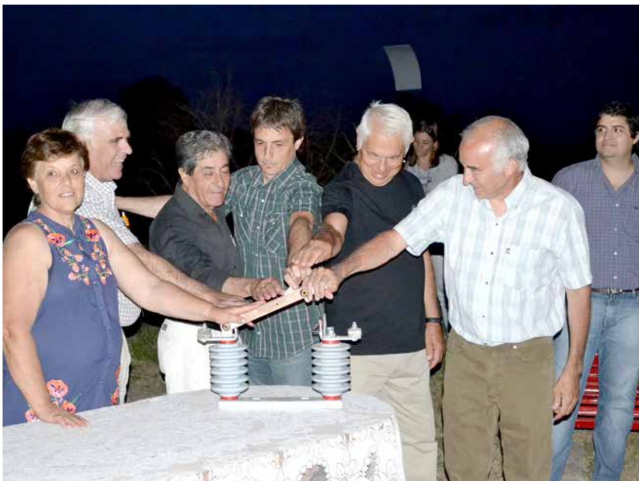
Momento en el que las autoridades dejan inauguradas las nuevas luminarias.

Corresponden a un nuevo espacio público recuperado por la comunidad, ubicado en las Avdas. General Quiroga y Buenos Aires. Inf. en Págs. 10 y 11.