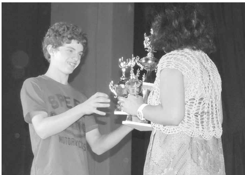
El Hockey de San Agustín tuvo se momento destacado.