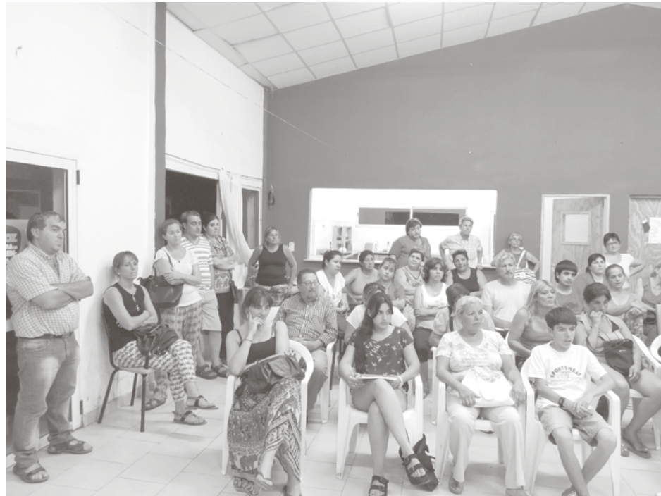
Concejales de distintos bloques escucharon el reclamo de los vecinos.