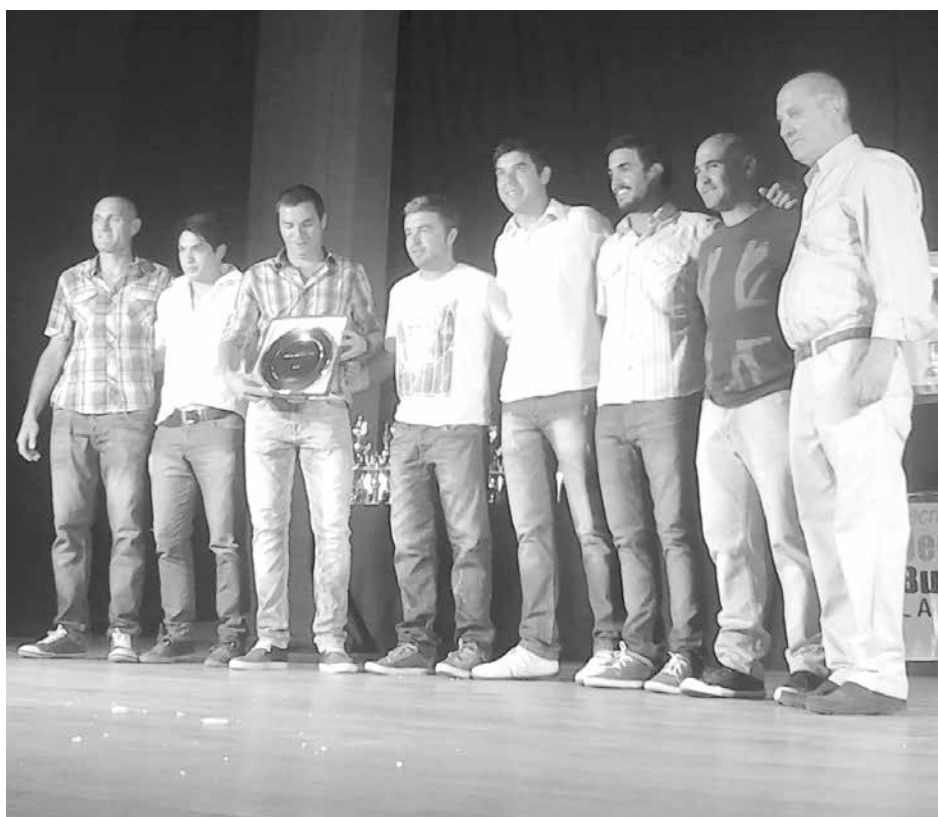
El Club Ciclista distinguió a los participantes de la Doble Bragado.