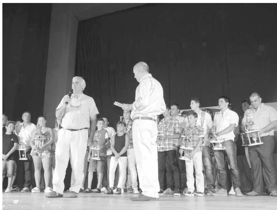
El Intendente dejó su mensaje al cierre del evento.

me esperaba esta distinción, ya que mucha gente ha logrado cosas muy importantes a nivel deportivo