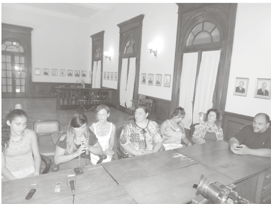
Alumnas contacto con los medios.

Finalmente, el concejal Eduardo Cerdeira expresó su satisfacción por la repercusión alcanzada por el proyecto presentado por su bancada, "fortaleciendo el desarrollo de las sesiones estudiantiles, que no se hacían desde hace dos años, con esta nueva instancia a nivel nacional; lo que por otra parte demuestra que no es tan cierto que los jóvenes no demuestran interés por las problemáticas de sus comunidades".