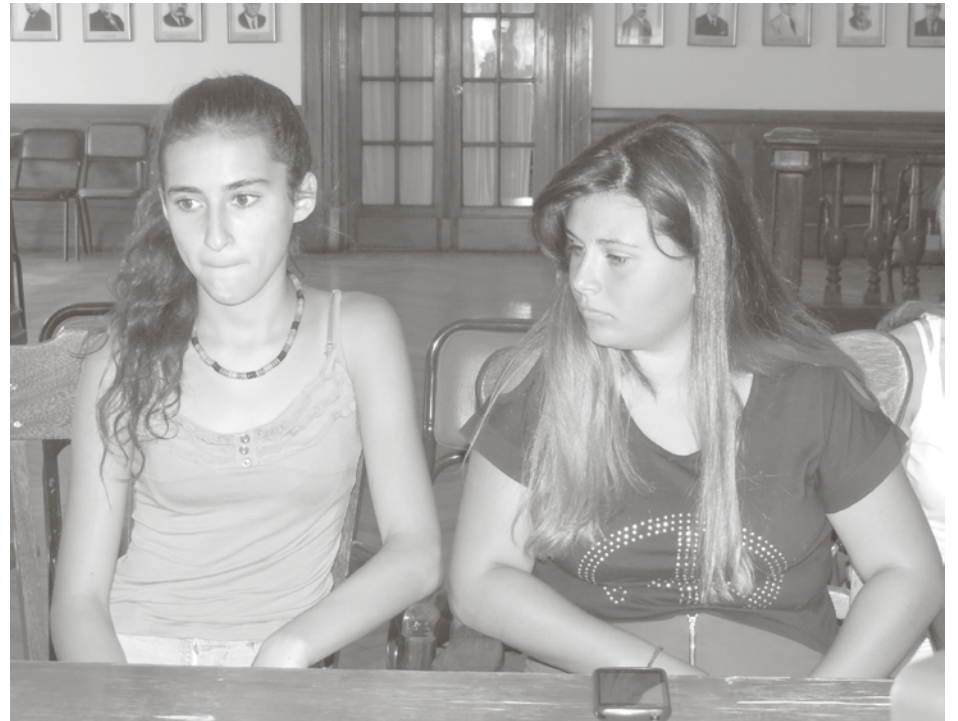
Dos de las jóvenes que participaron en la Cámara de Diputados de la Nación.

En la jornada del miércoles, el H. Concejo Deliberante de 9 de Julio recibió en su seno a las alumnas de la Escuela Secundaria Nro. 8 extensión 12 de Octubre, quienes acompañados por docentes, autoridades educativas e inspectores del área, participaron de las sesiones estudianti-