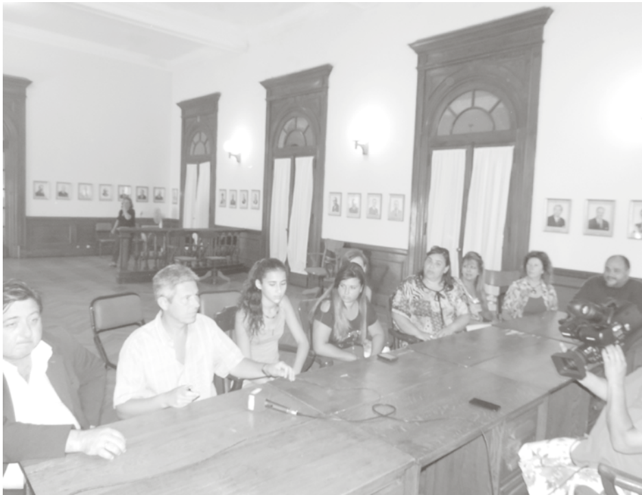
Autoridades del HCD y educativas explicaron la experiencia vivida.