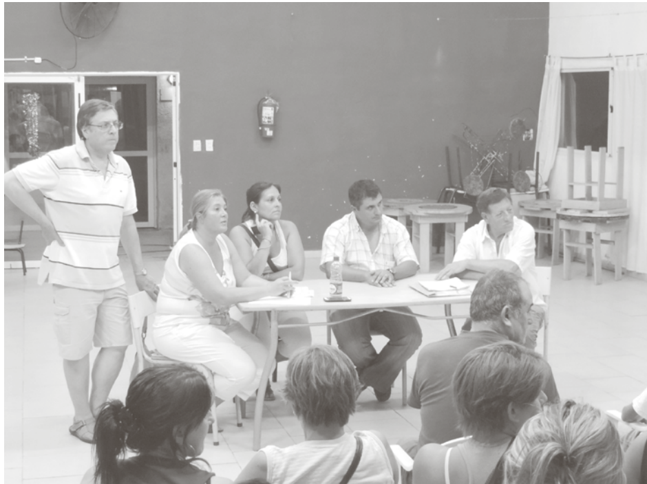
Integrantes de "9 de Julio, todos por el agua" junto a autoridades municipales.

Expusieron la problemática que sufren y reclamaron que se solucione la situación de inmediato.