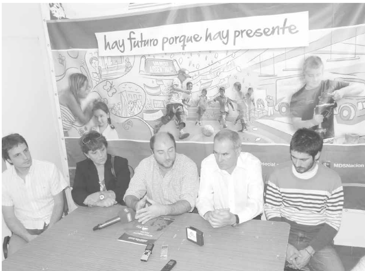
Autoridades de Desarrollo Social junto al Integrantes del Club y Cooperativa de Quiroga.