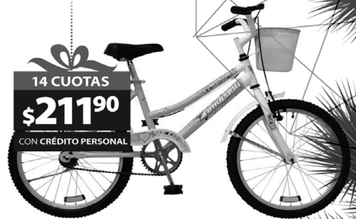
5. BICICLETA TOMASELLI LADY ROD.20 Parante, guardabarros, canasto, cubre cadena. Origen: Argentina.(18790)

VENI A NUESTRO LOCAL 9 DE JULIO, ROBBIO 860