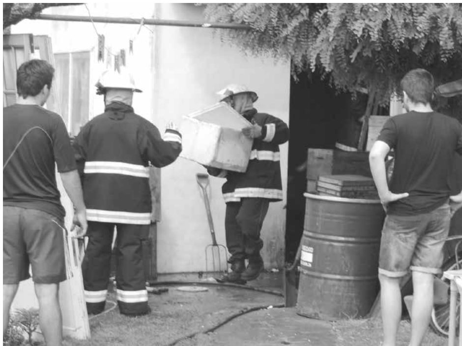
Personal de Bomberos trabaja en el lugar del siniestro.