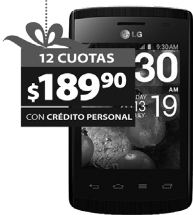
3. CELULAR LG E411 L1 2MP. Android v4.1.2. GPS. 3G. Origen: Argentina.(18987)