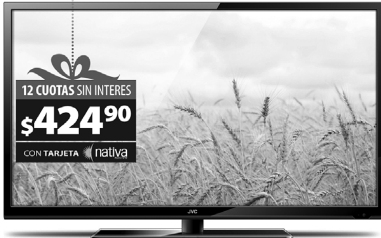
1. TV LED JVC LT39DA530 39" FULL HD. TDA. HDMI x 2. USB. Origen: Argentina.(20231)