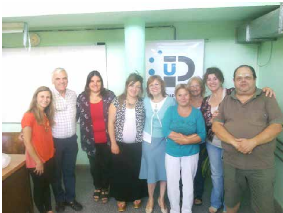
Integrantes de la UP acompañados del Intendente.

las Municipales de Artes y Oficios desarrollaron sin dificultad sus reconocidas funciones de aporte al desarrollo cultural y social en las localidades de Dudignac y Facundo Quiroga.