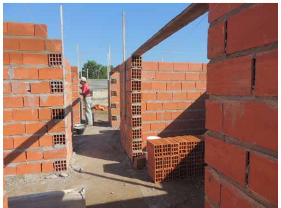
Vista de las obras que lleva adelante el municipio.