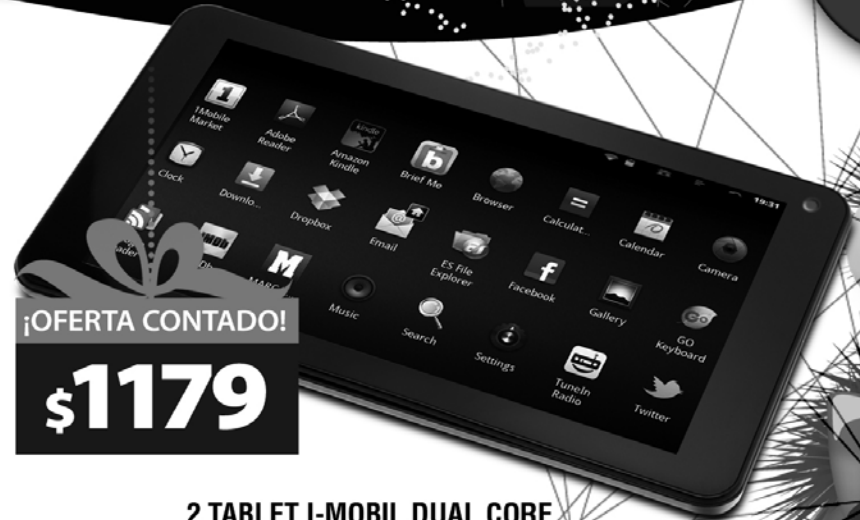
2. TABLET I-MOBIL DUAL CORE 7 pulgadas. Android 4.2. HD 8Gb. RAM 1Gb. Wifi. USB. Origen: China.(20207)