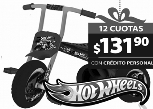
4. TRICICLO UNIBIKE MAX HOT WHELL Mayores de 4 años. Estructura metálica y plástico. Origen: Argentina.(13114)