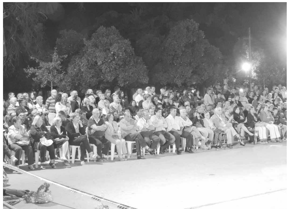
Autoridades municipales y vecinos presentes en el evento.