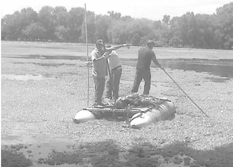
Empleados municipales trabajaban sacando las carpas muertas.

Se detallaron posibles causas de la situación y se reiteró que se adquirirá una dragalina para la eliminación de las plantas acuáticas.