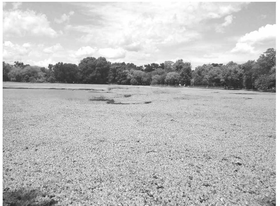
Gran parte de la laguna del parque esta cubierta con especies de plantas.