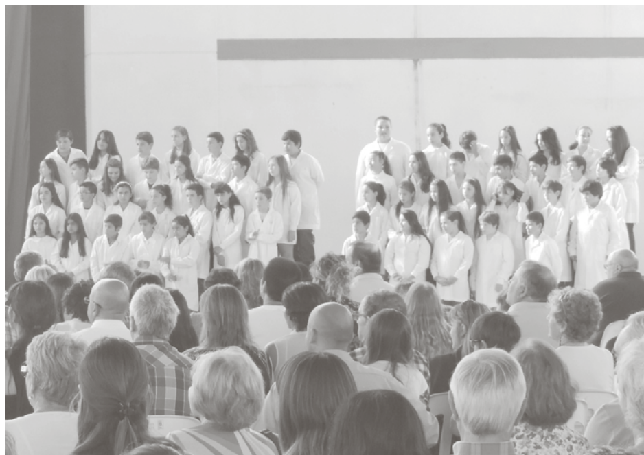
Alumnos, docentes y familiares en el acto de egresados 2014.

En la mañana del pasado viernes, el nivel primario de la Escuela Normal Superior de 9 de Julio, desarrolló en su establecimiento su acto de egresados del nivel primario, instancia que contó con la presencia de autoridades educativas, padres y familiares de los egresados, junto a toda la comunidad educativa.