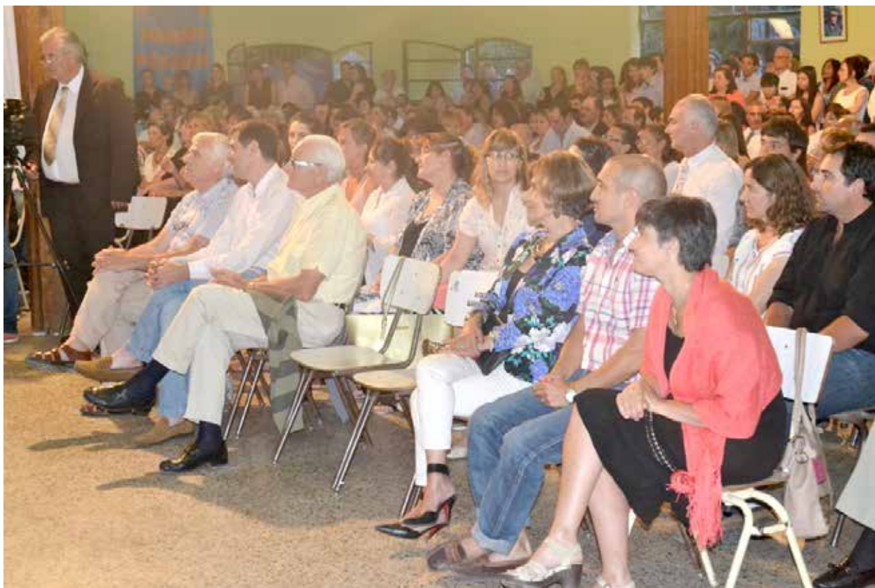
Autoridades educativas, municipales y familiares presentes en el acto académico.