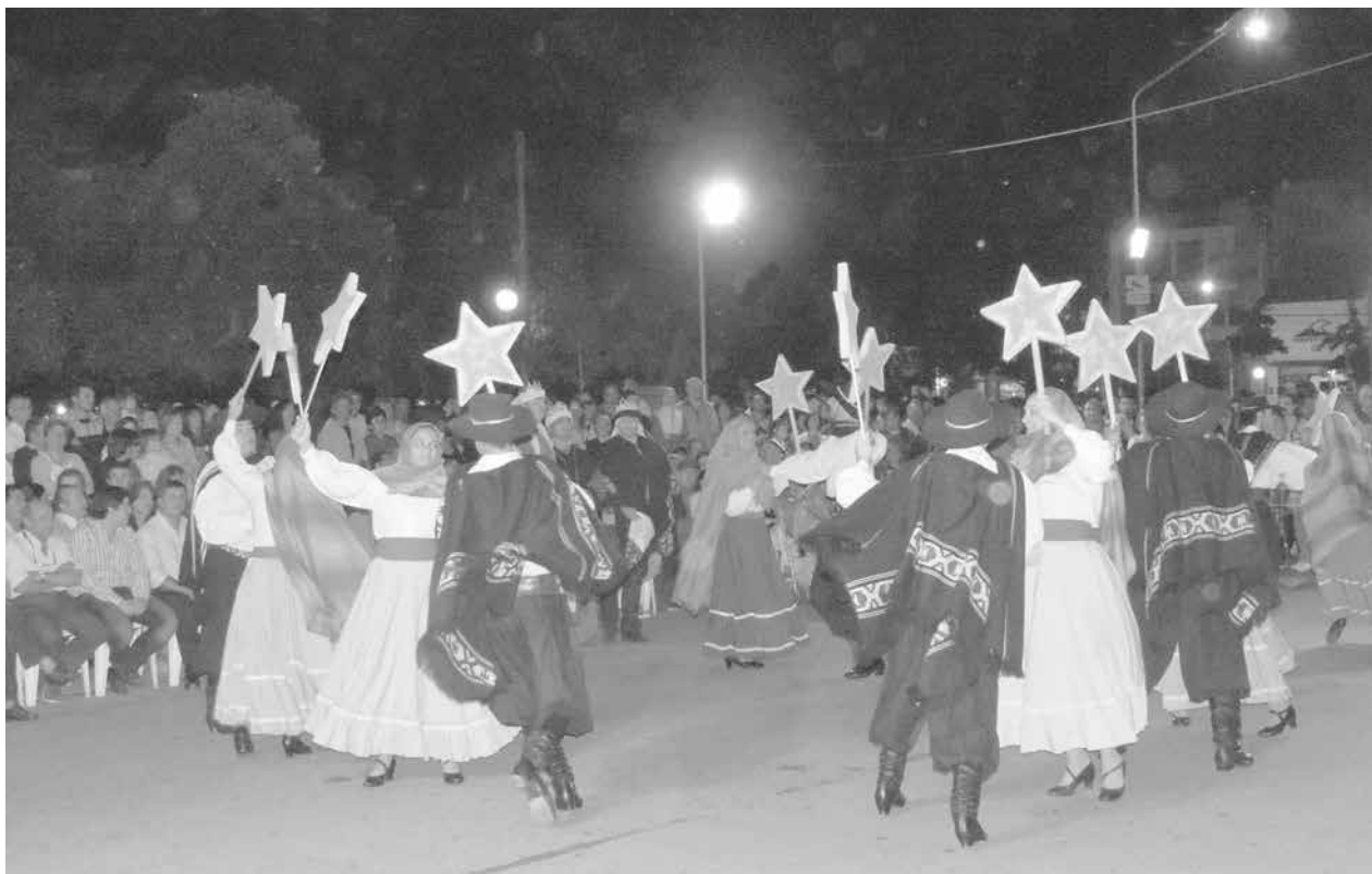
Representación de la misa criolla en el cierre de la jornada.