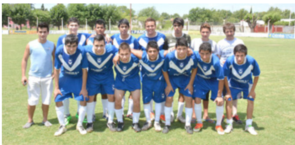
5ta de El Fortín.