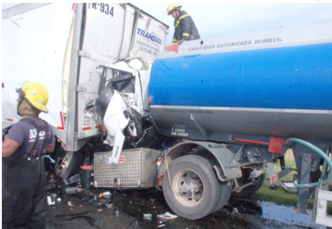
El camión Fiat Iveco frontalmente incrustado debajo del otro camión parado sobre la Ruta.