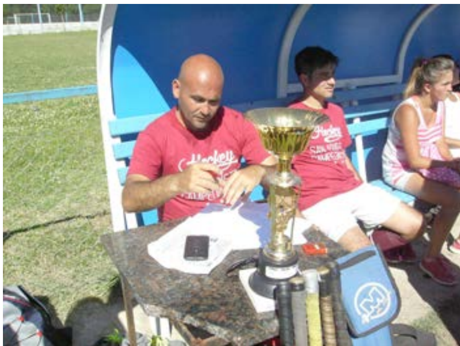
Integrantes del Hokey de San Agistín posan con el trofeo ganado.

En la jornada de ayer, el Hóckey masculino del Club Deportivo san Agustín sumó un nuevo e importante logro. Tras haberse consagrado días atrás campeón de la Liga del Sur, obtuvo la Supercopa, superando a Bragado Club, Sarmiento de Junín, Banco Nación de Bragado y San Martín de 9 de Julio.