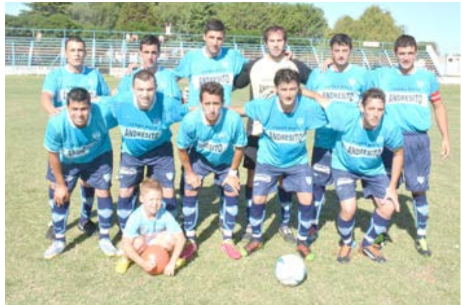
Equipo de Atlético San Martín.