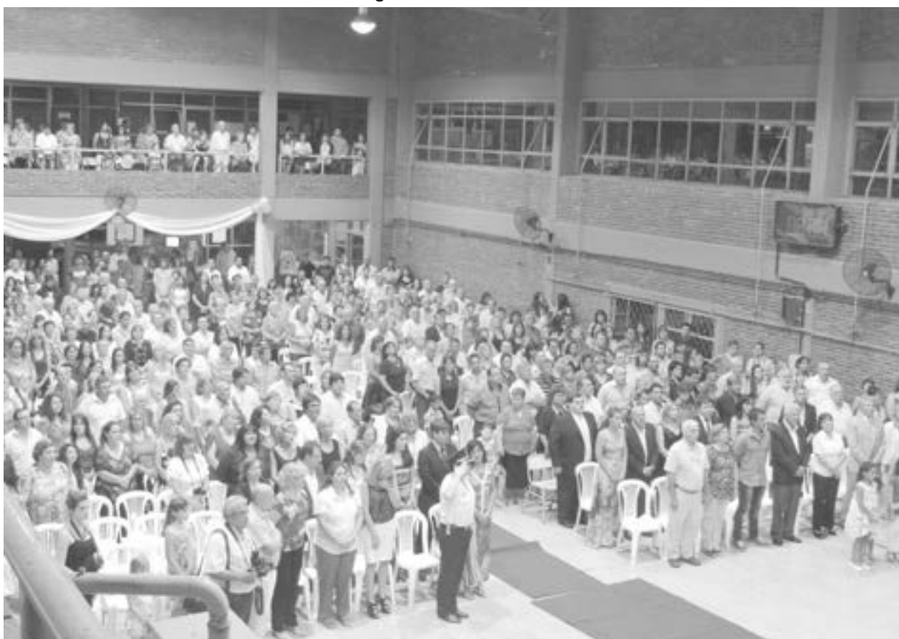
Importante asistencia de autoridades municipales, docentes, policiales y familiares de los alumnos.

Tras el cambio de abandonados, se entregaron distinciones a los mejores compañeros y reconocimientos a profesores con 25 años de servicio. Asimismo se procedió a