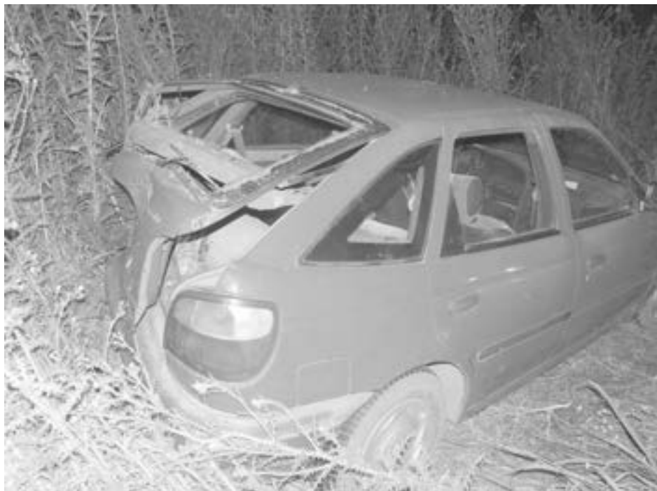
El Pointer muestra el fuerte impacto en el lado trasero izquierdo.