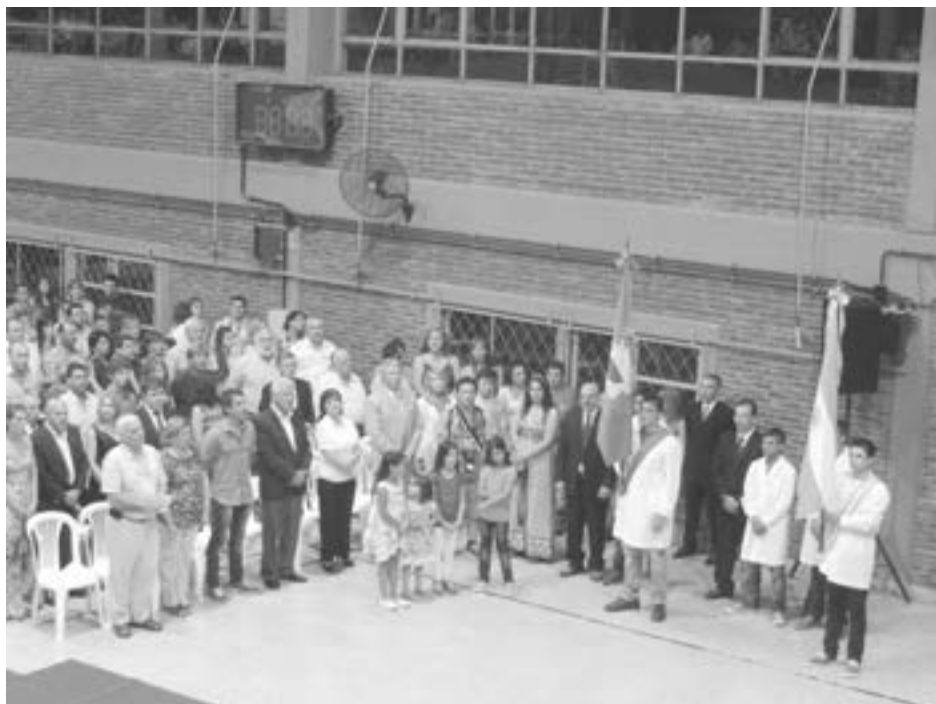
Importante acto de fin de curso de la EET Nro. 2.