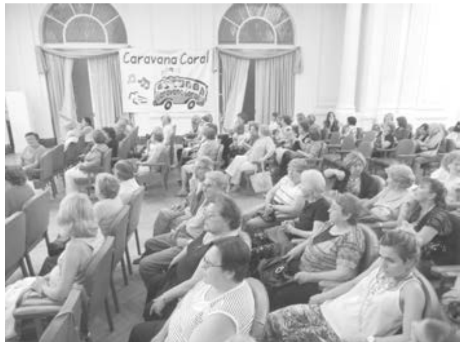
Importante concurrencia acompañó la Caravana Coral Solidaria. Fotos De Sogos.