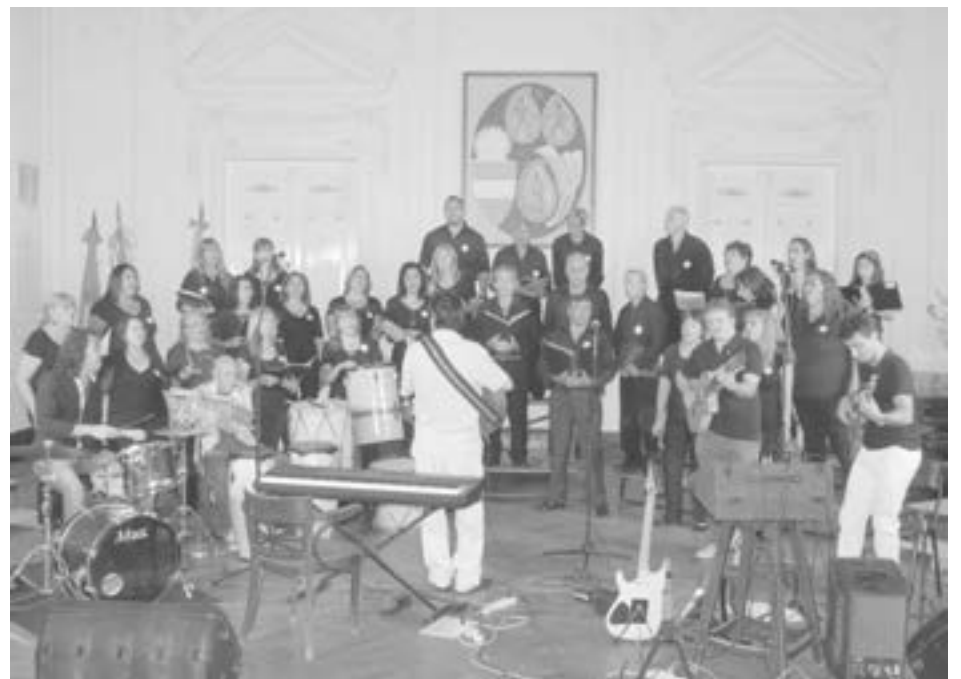
El Coro Polifónico abrió la velada del sábado a la noche.