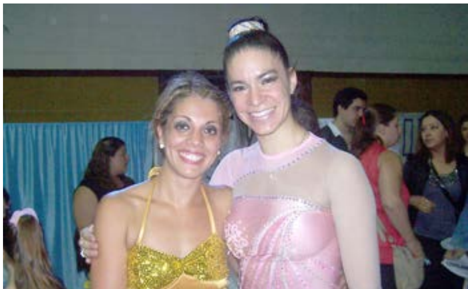
vez que destacó que para el 2015 se prepara para el Mundial y el Sud América y un Show de Campeones en el Paseo la Plaza de calle Corrientes en Ciudad Autónoma de Buenos Aires. Prensa Club San Martín