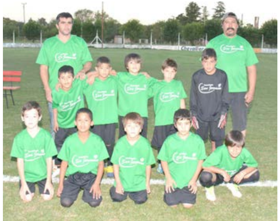
Panadería San Jerónimo.