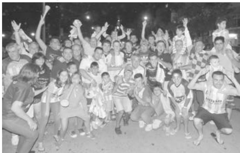
Tuvieron que esperar hasta el pitazo final, pero los hinchas locales de Racing destaron su alegría en Plaza Belgrano, después de 13 años y "sufrir" hasta el último minuto.