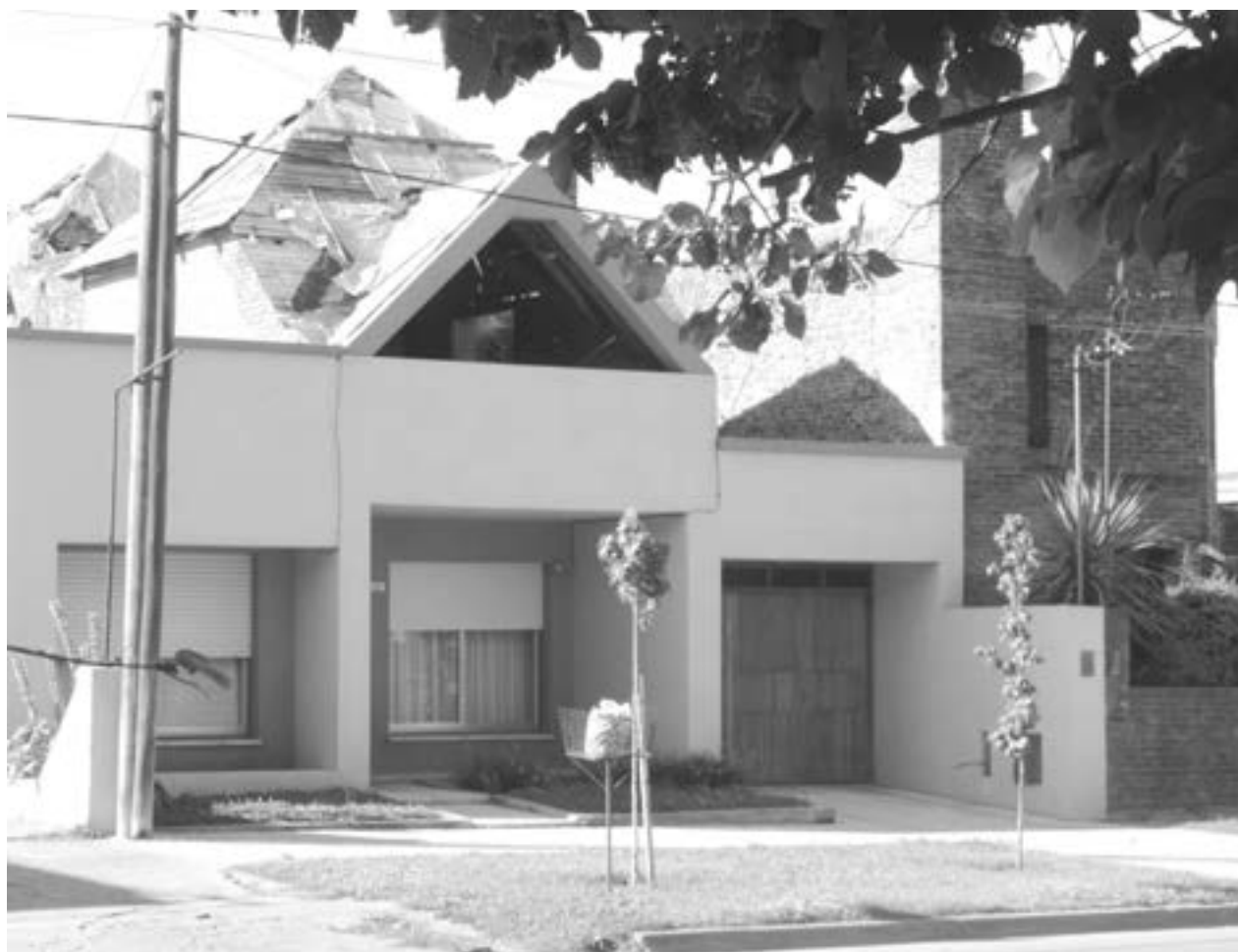
Vista del domicilio víctima de robo durante la corta ausencia de sus dueños.