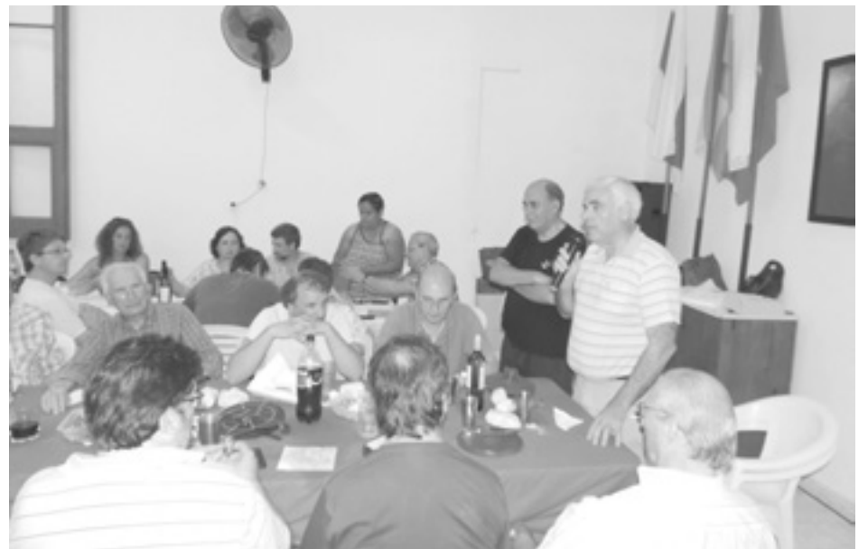
El Intendente se dirige a los presentes.

“Estos vecinos militantes radicales son quienes defendieron los ideales democráticos del radicalismo y han colaborado siempre con nuestro partido y nuestra