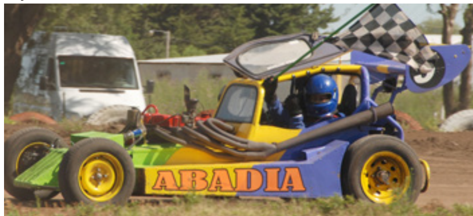
Martín Abadía piloto de Lincoln es el flamante campeón 2014 de la Limitada 6 cilindros.