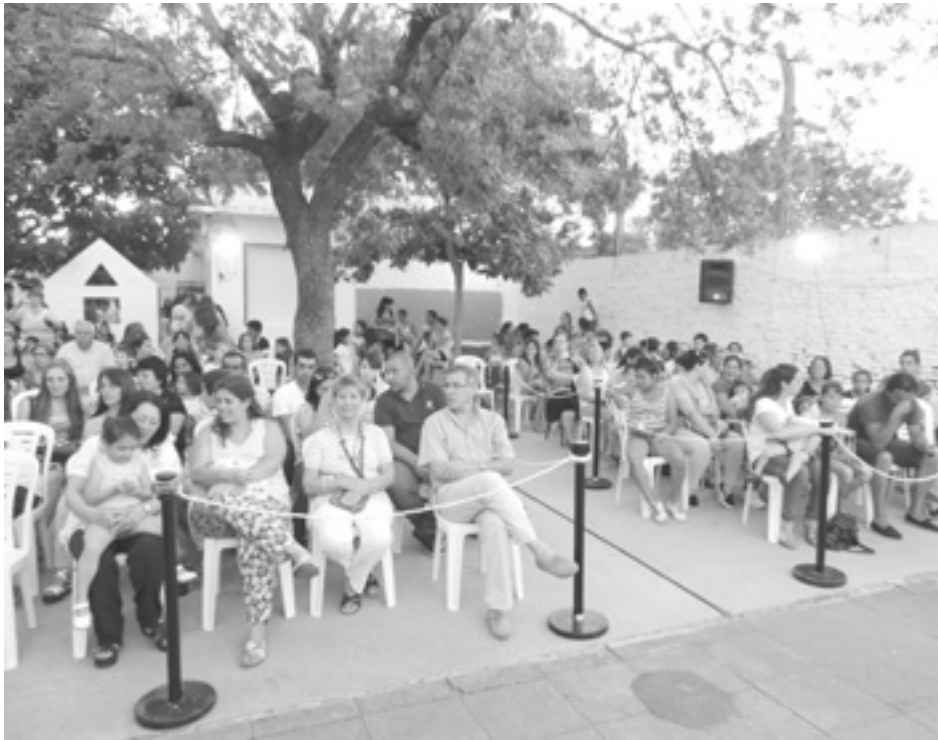
Autoridades educativas y familiares en el acto de cierre del ciclo lectivo.

En la tarde del pasado viernes, el Centro Educativo Complementario (CEC) Nro. 801 “Pibelandia” desarrolló su ya tradicional cierre de las actividades anuales, con un grato y colorido acto que tuvo lugar en su sede, en el que se compartieron