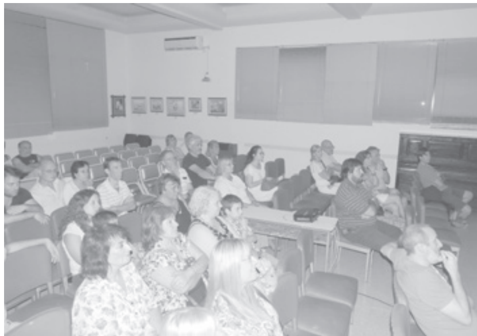
Asistentes a la Biblioteca "José Ingenieros" el pasado viernes.