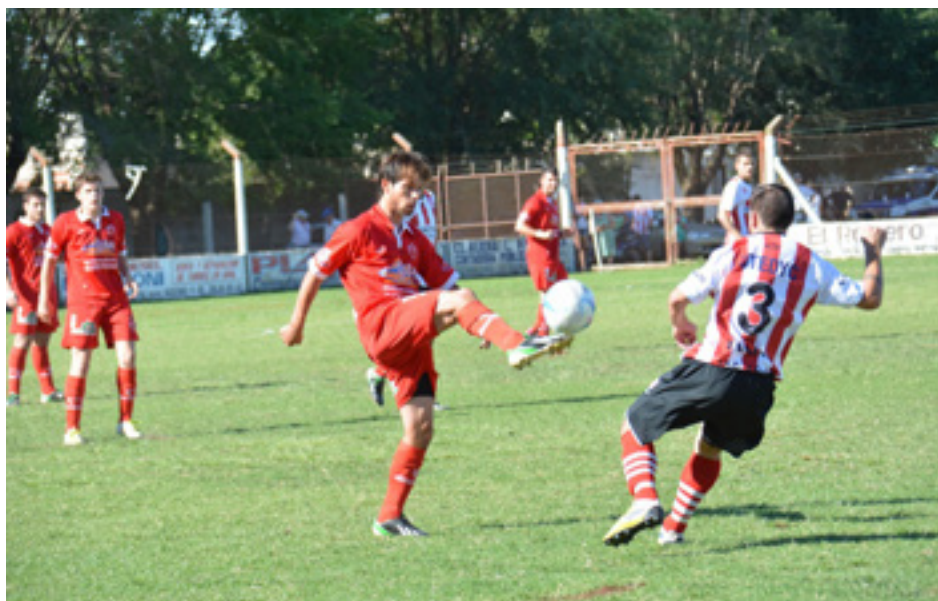
El Rojo hizo valer las individualidades.