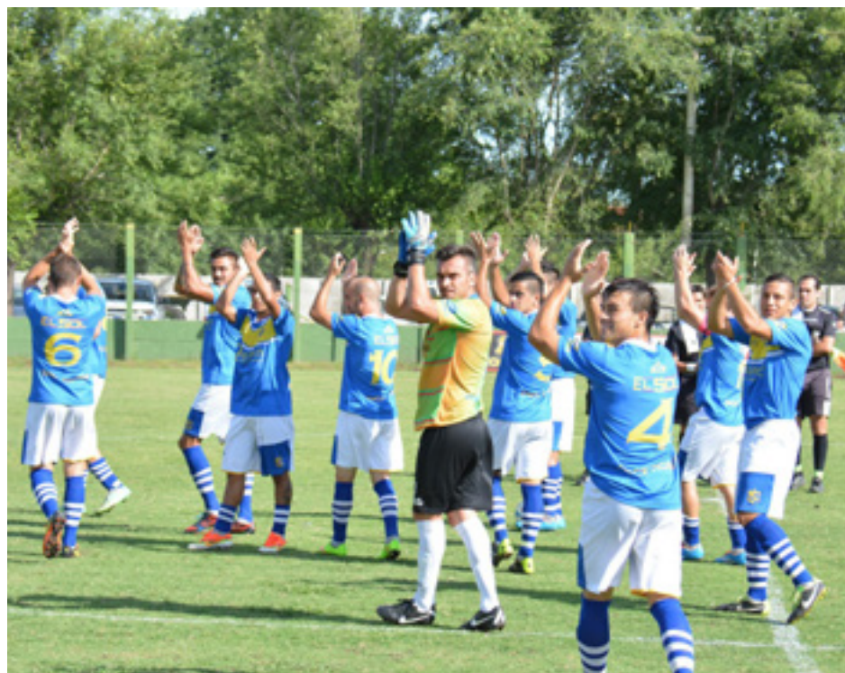
El público despidió con aplausos al equipo.