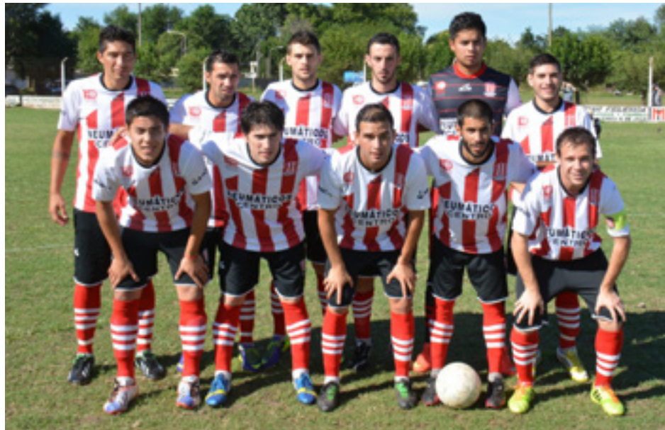
Plantel de Atlético 9 de Julio.