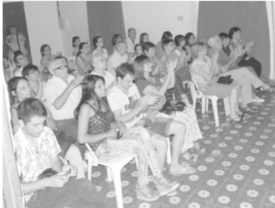
El público acompañó el concierto denominado Edén.