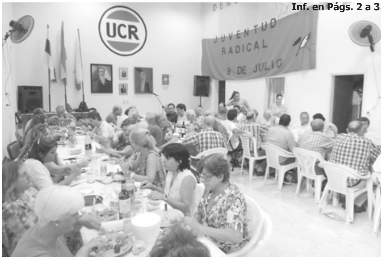
El centenario partido reconoció en el mediodía del sábado a ex concejales y ex consejeros escolares, en un importante encuentro.