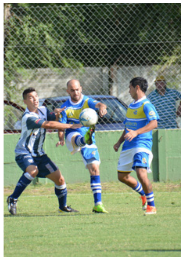
Colombo no estuvo en su nivel.

GAU ALMACEN DE RAMOS GENERALES MENDOZA casi MITRE