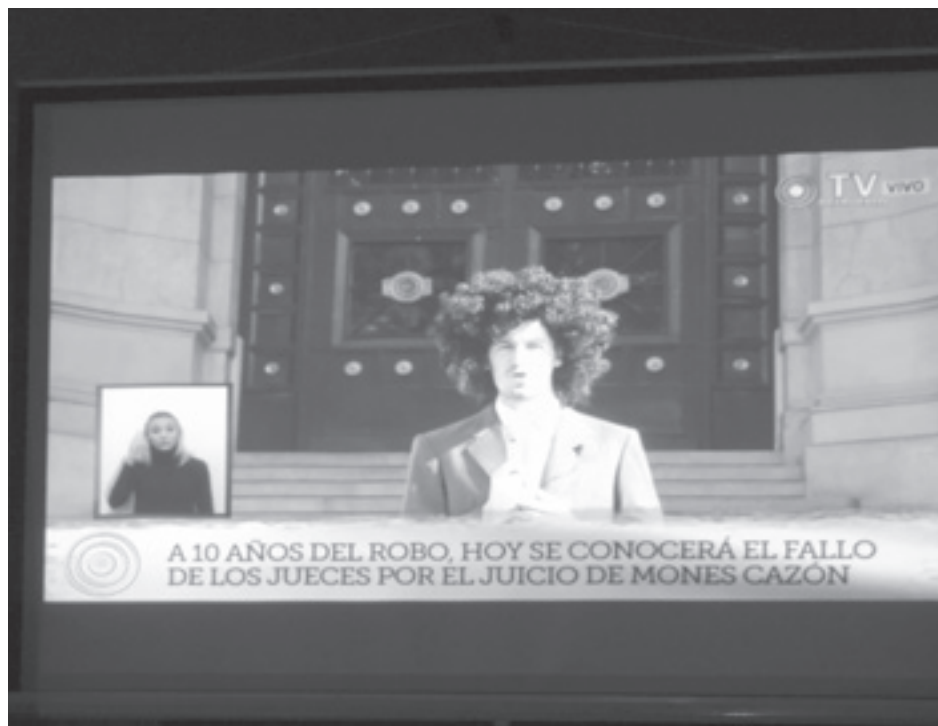
Se puede ver en la pantalla uno de los cortometrajes presentados.