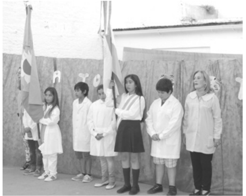
Directivos, docentes y abanderados del establecimiento educativo.

lias con el centro, mostrando el trabajo de los chicos a lo largo de todo el año”. “Como sabemos, el Centro es el ámbito donde los chicos complementan sus actividades escolares, encontrando no solamente apoyo en la enseñanza, sino