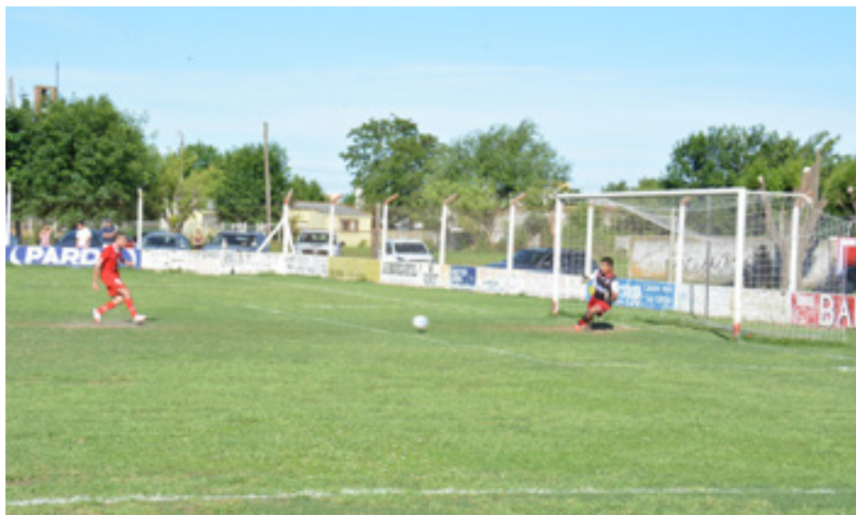
Ignacio Bossio pone el 2 a 1 de tiro penal.

y prácticamente a "dedo", por la deserción de varios equipos a último momento.