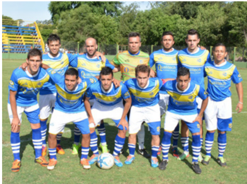
Equipo de Once Tigres.

El conjunto de Márquez no pudo doblegar a El Linqueño, que también quedó eliminado.