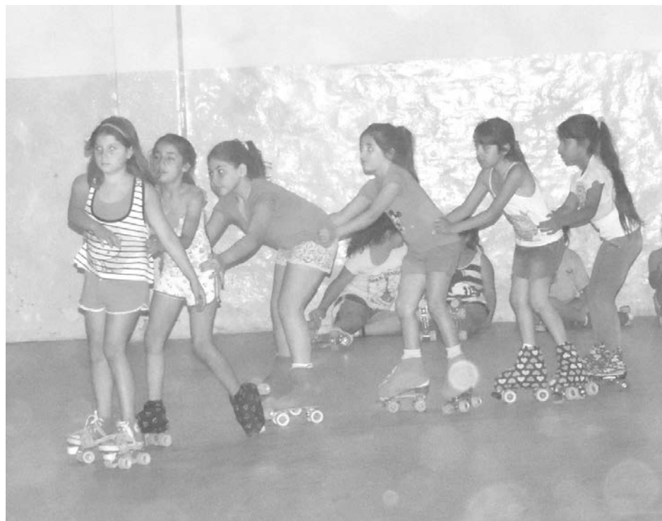
Alumnas y profesores de patín realizan el cierre del año.