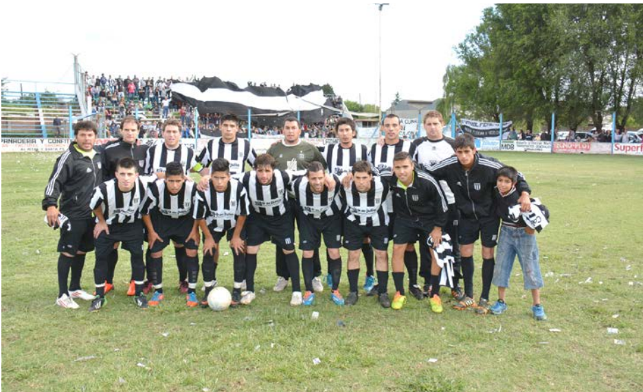
Plantel Campeón de Atlético French.

violeta, por provenir de la categoría superior, definirá en la revancha como local y además, en caso de igualdad de resultados, tendrá ventaja deportiva.