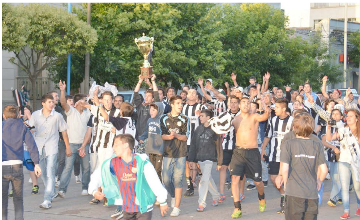
Los festejos se trasladaron al centro de la ciudad.