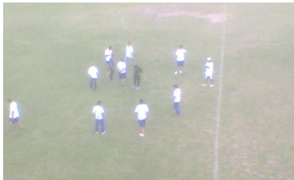
El precalentamiento de Once Tigres quedó trunco.