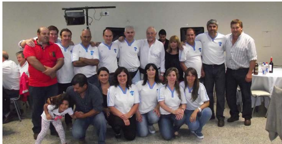
Autoridades del club y colaboradores, posan para los medios de prensa.