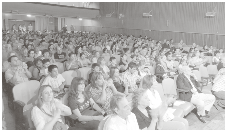
Asala llena en el Rossini, se desarrolló el acto del Rotary.

Asimismo, el presidente del Rotary Club de 9 de Julio expresó que bajo el lema "Dar de sí, antes de pensar en sí reúne a más de un millón de integrantes en todo el mundo" y en este contexto "se ha querido distinguir a estos alumnos".