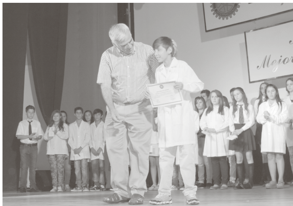
El Intendente entrega el diploma a un alumno elegido "Mejor Compañero".