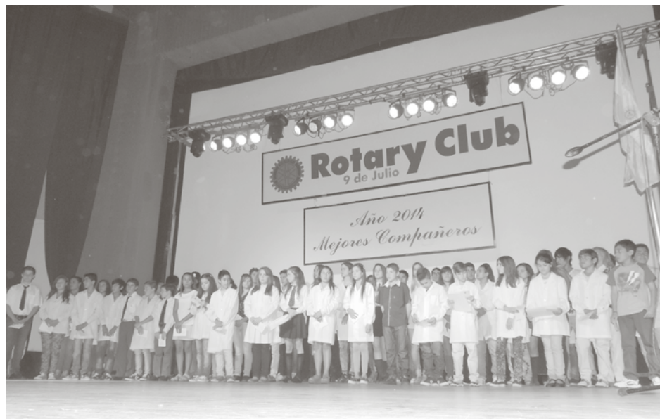
Alumnos elegidos en los distintos establecimientos educativos.