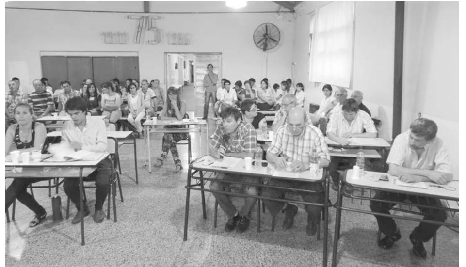
Bloques del Concejo Deliberante en la Escuela Nro. 7 y Secundaria Nro. 9.

“Sería muy bueno que pueda disponerse del mismo”, señaló y si bien dijo desconocer los montos, consideró que cualquier inversión “sería beneficiosa para el pueblo”.