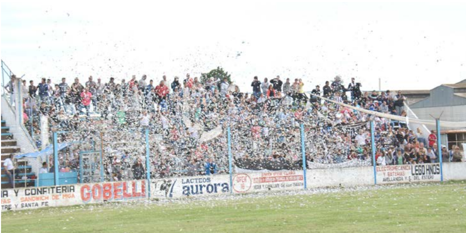
Gran acompañamiento del público albino.