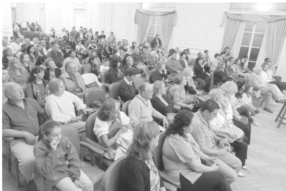
Importante concurrencia acompañó el concierto musical.