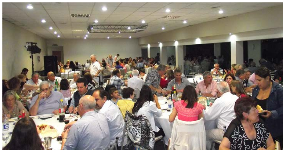
Los sanmartinianos tuvieron su gran noche de Fin de Año.