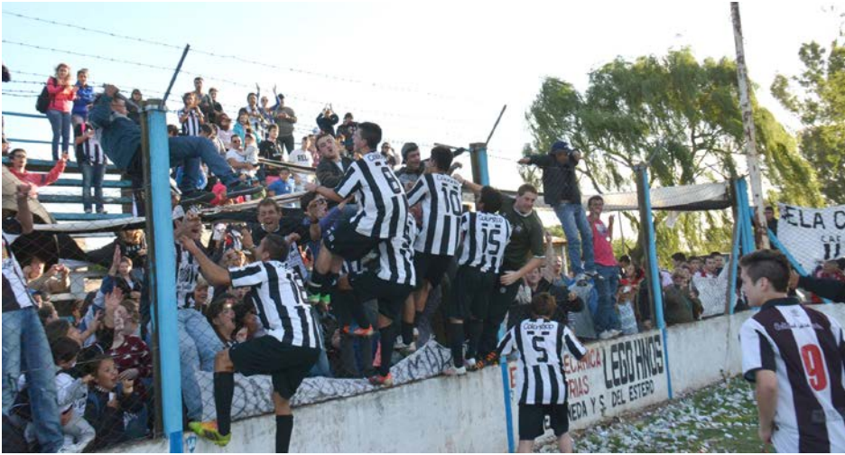
Jugadores e hinchas festejan el título.

Pese a ganar sin mayores complicaciones ante Once Tigres por 4 a 1, Atlético Quiroga será el equipo que deberá jugar la Promoción ante 12 de Octubre, dado que la Niña se impuso por a 1 ante el descendido El