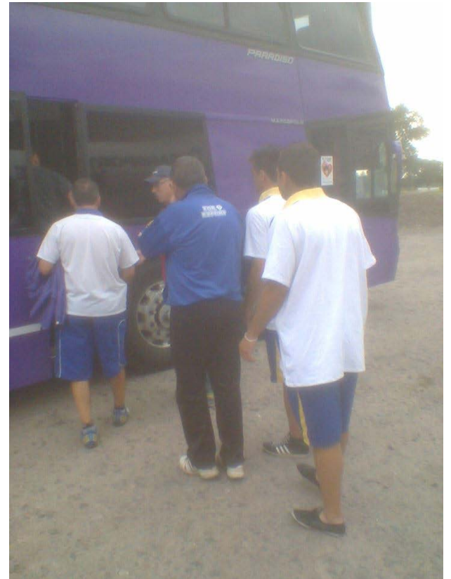
El plantel viajó innecesariamente.

POSICIONES: Rivadavia 32, Agropecuario 20, Juventud 19, El Linqueño y Once Tigres 16, Bragado Club 11, J. Newbery 6 y Social Obrero 4.