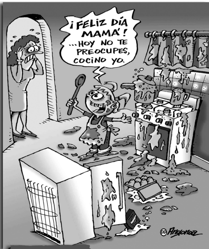
Hoy no cocinas