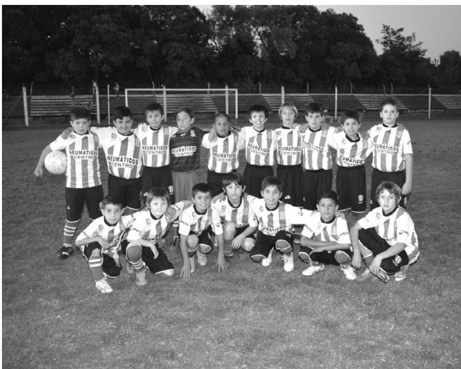
Atlético 9 de Julio 2005