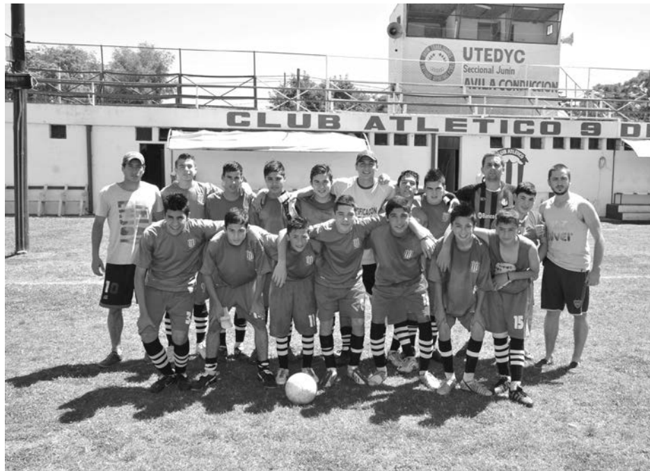
6ta categoría de Dudignac.