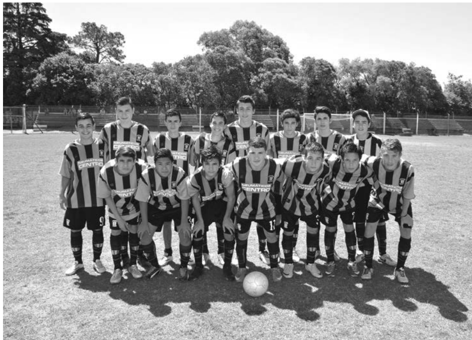
6ta categoría de Atlético 9 de Julio.