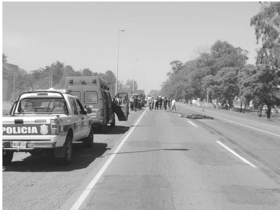
La Ruta 5 estuvo cerrada al tránsito mientras la Ayudante Fiscal, Bomberos Voluntarios y Policía trabajaron en el lugar del accidente.

Simpatizante caracterizado del Club Atlético