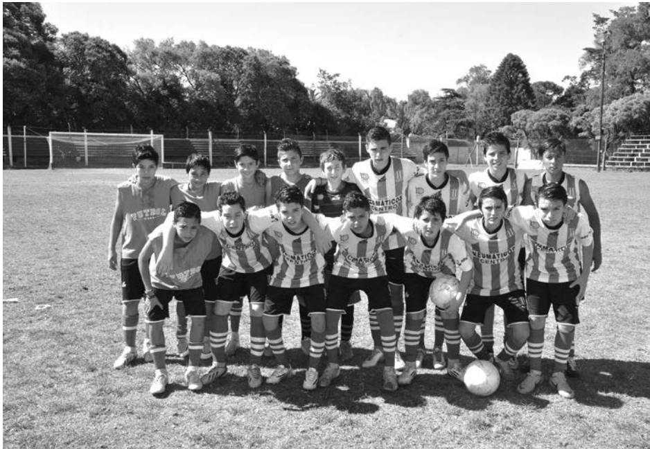
8va categoría de Atlético 9 de Julio.