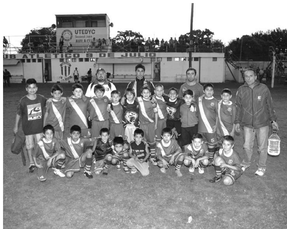
Once Tigres 2005