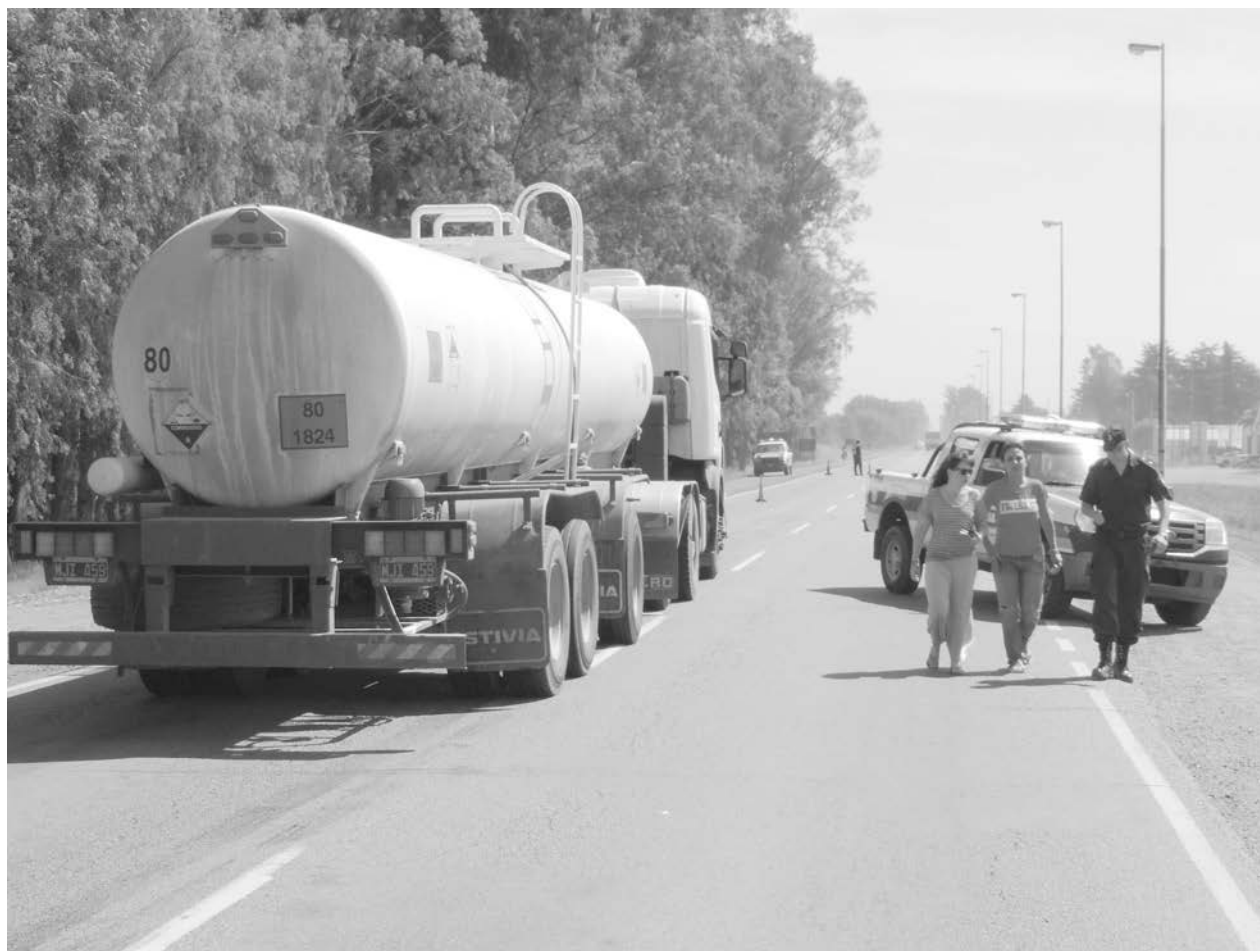
La tragedia se desató ayer a las 14 hs. en la Ruta Nacional Nro. 5.

Perdió la vida en el acto - Se trata de un conocido y apreciado comerciante de nuestra ciudad, quien contaba con 53 años. Inf. en Pág. 3.