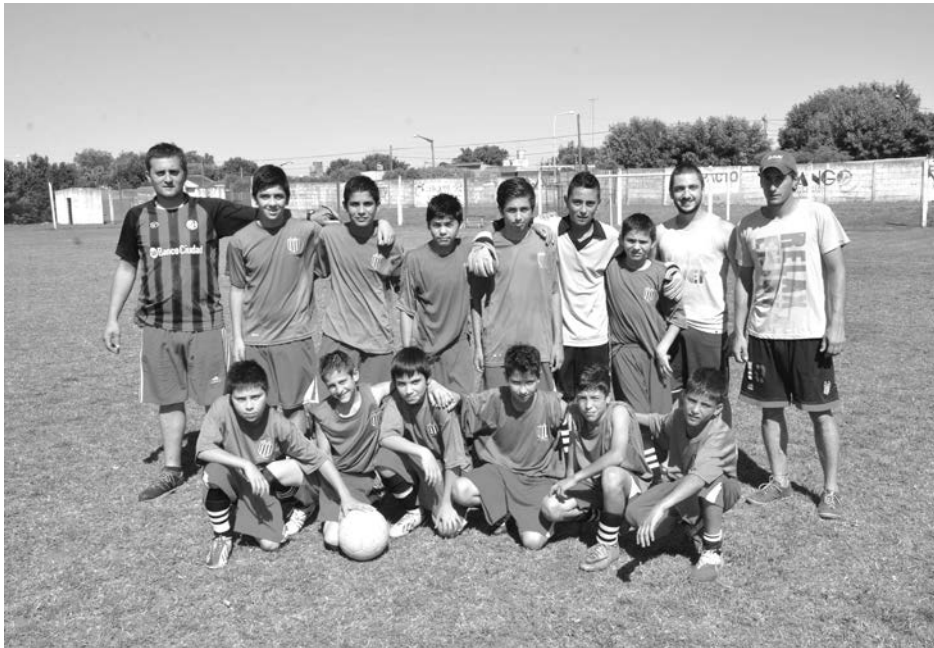
8va categoría de Dudignac.