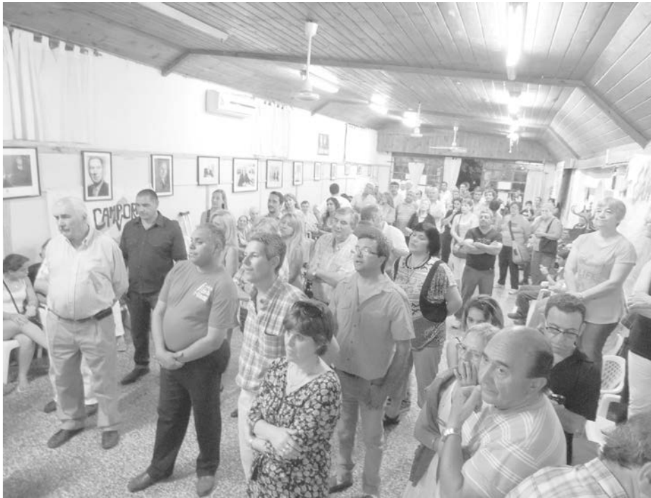
Numerosa concurrencia festejó el Día de la Militancia y compartió el espectáculo que rememoró temas de Leonardo Favio entre otros de la década del 70.

En la jornada de ayer, en las instalaciones de la Unidad Básica "Juan Domingo Perón" de calle Mendoza 323, se desarrolló la conmemoración del Día del Militante Peronista, instancia que contó con una importante presencia de afiliados y vecinos.