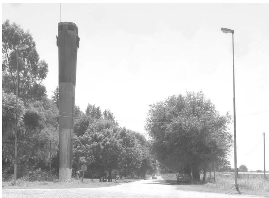
La localidad arriba en este calendario a su 127º aniversario.