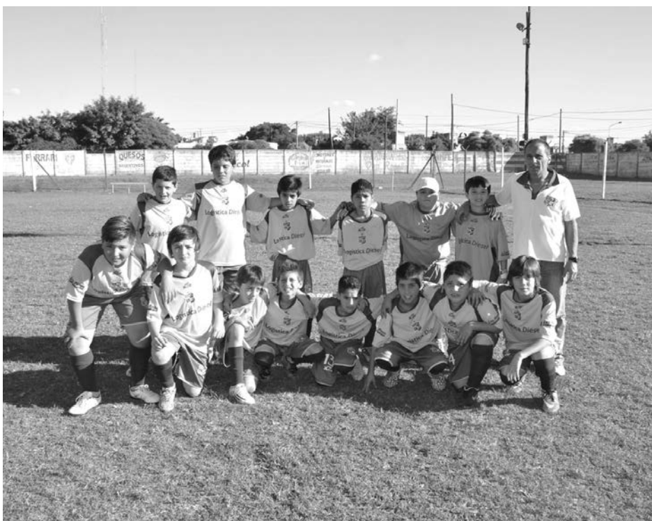
Once Tigres 2003