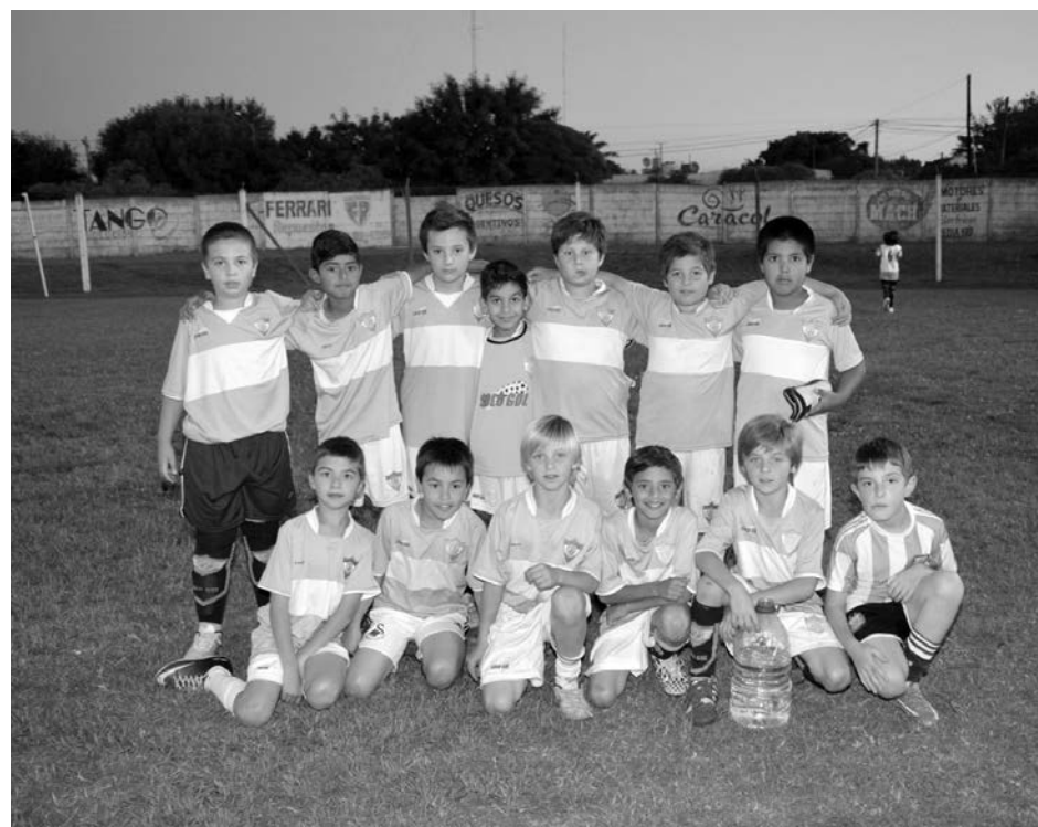
San Martín 2005.