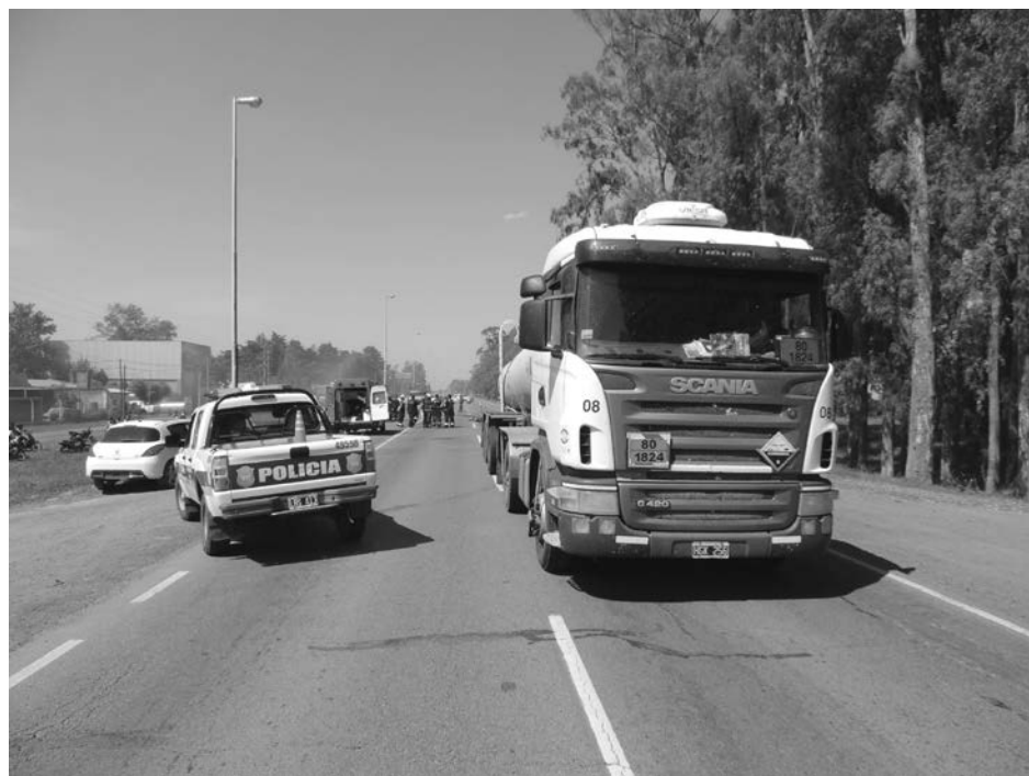
Imagen del camión protagonista del trágico hecho.